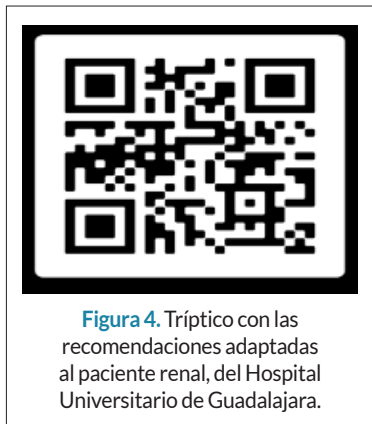
Figura 4. Tríptico con las recomendaciones adaptadas al paciente renal, del Hospital Universitario de Guadalajara.

restricciones hídricas y dietéticas propias de la enfermedad renal, por lo que el HUGU adaptó estas recomendaciones a sus necesidades. Concretamente, se recomendó el consumo de aquellas frutas con mayor contenido en fibra, pero menor contenido de potasio (frambuesas, peras, manzanas) 24 , así como las técnicas de cocinado pertinentes para reducir el contenido en potasio y fósforo de verduras y legumbres 24,25 . Además, se recalcaron las limitaciones de ingesta hídrica del paciente en función de su diuresis residual (500-750 ml+diuresis) 26 . Estas recomendaciones se encuentran detalladas en un tríptico (ver figura 4 ).